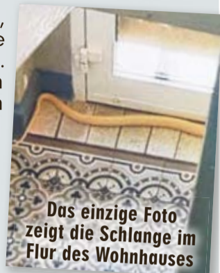
Das einzige Foto zeigt die Schlange im Flur des Wohnhauses

Derweil räumte die Stadt ein, dass es bei Schlangenbesitzer Patryk S. (22) im Vorfeld Probleme gab. Chudziak: „Der Halter hatte konkret bei uns 13 Schlangen gemeldet. Wir ha-